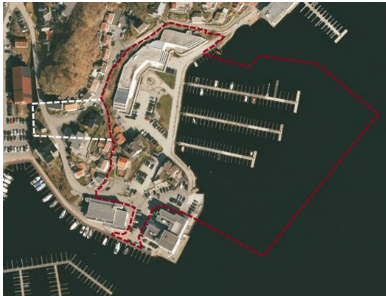
Planområde på bakkenivå markert med rød stiplet linje og under bakkenivå (gangtunnel) markert med hvit stiplet linje.

Arkitektfaglig kompetanse i evalueringsgruppen oppnevnes av NAL. NAL bistår med gjennomføringen av arkitektkonkurransen